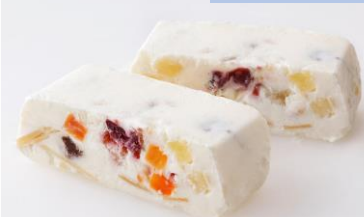
冷凍保存でカットするのみ