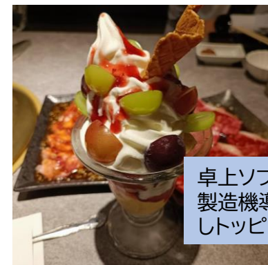
卓上ソフトクリーム 製造機導入し、製造 しトッピング